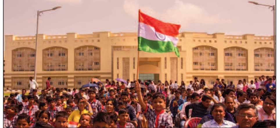
फोटो: केन्द्रीय विद्यालय के विद्यार्थी तिरंगा फहराते हुए