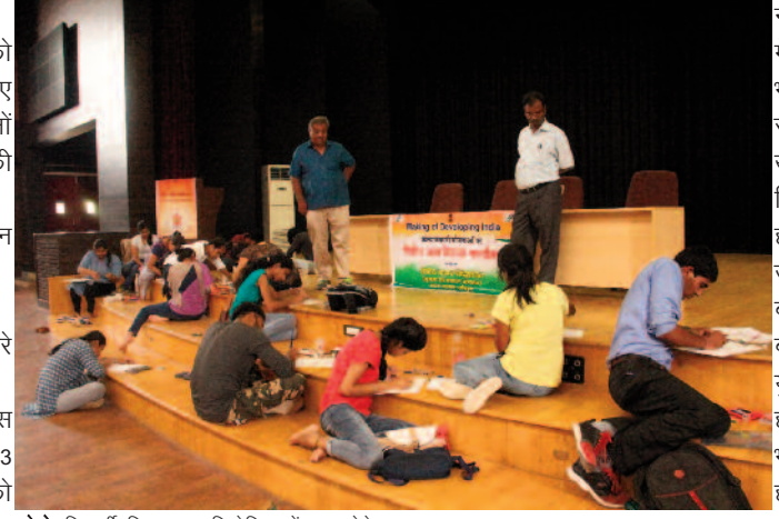
फोटो: विद्यार्थी चित्रकला प्रतियोगिता में भाग लेते हुए

राजस्थान केंद्रीय विश्वविद्यालय में तीसरे नेशनल हैण्डलूम दिवस के मौके पर 3 अगस्त को चित्रकला