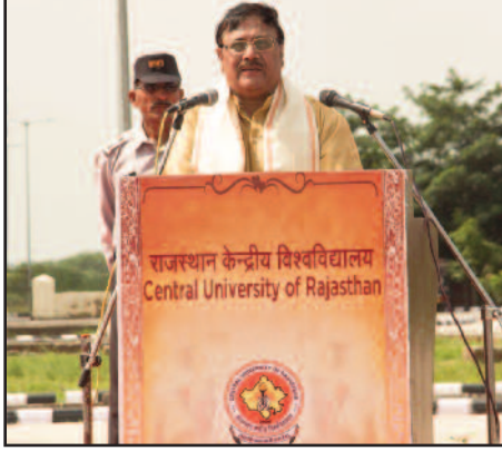
फोटो: माननीय कुलपति महोदय सम्बोधित करते हुए